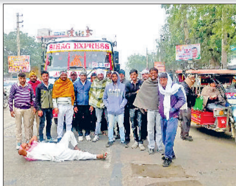
भिवानी। निजी बस चलाए जाने के विरोध में सड़क पर लेटा चालक और हिट एंड रन नियम के विरोध में तोशाम में धरने पर बैठे चालक।

26 दिसंबर को केंद्र सरकार द्वारा लोकसभा में न्याय संहिता बिल पारित किया गया है। इस बिल में यह प्रावधान किया गया है कि दुर्घटना के समय वाहन चालक द्वारा घायल व्यक्ति को अस्पताल