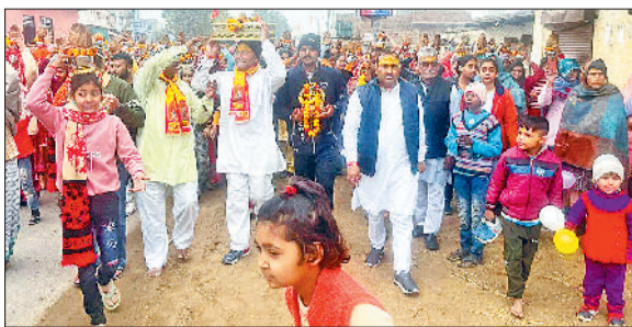
भिवानी। कलश यात्रा में शामिल श्रद्धालुगण।