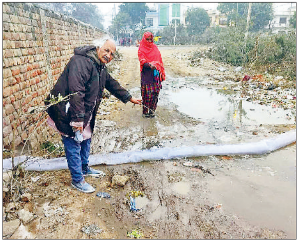
भिवानी। सड़क पर जमा सीवरों के गंदे पानी से सेक्टरवासी परेशान